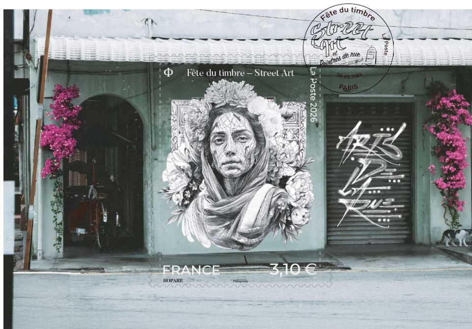
Visuels d'après maquettes - Couleurs non contractuelles/disponibles sur demande

La FÊTE DU TIMBRE 2026 se déroule dans 75 villes de France, du 6 au 8 mars 2026 sur les arts de la rue.